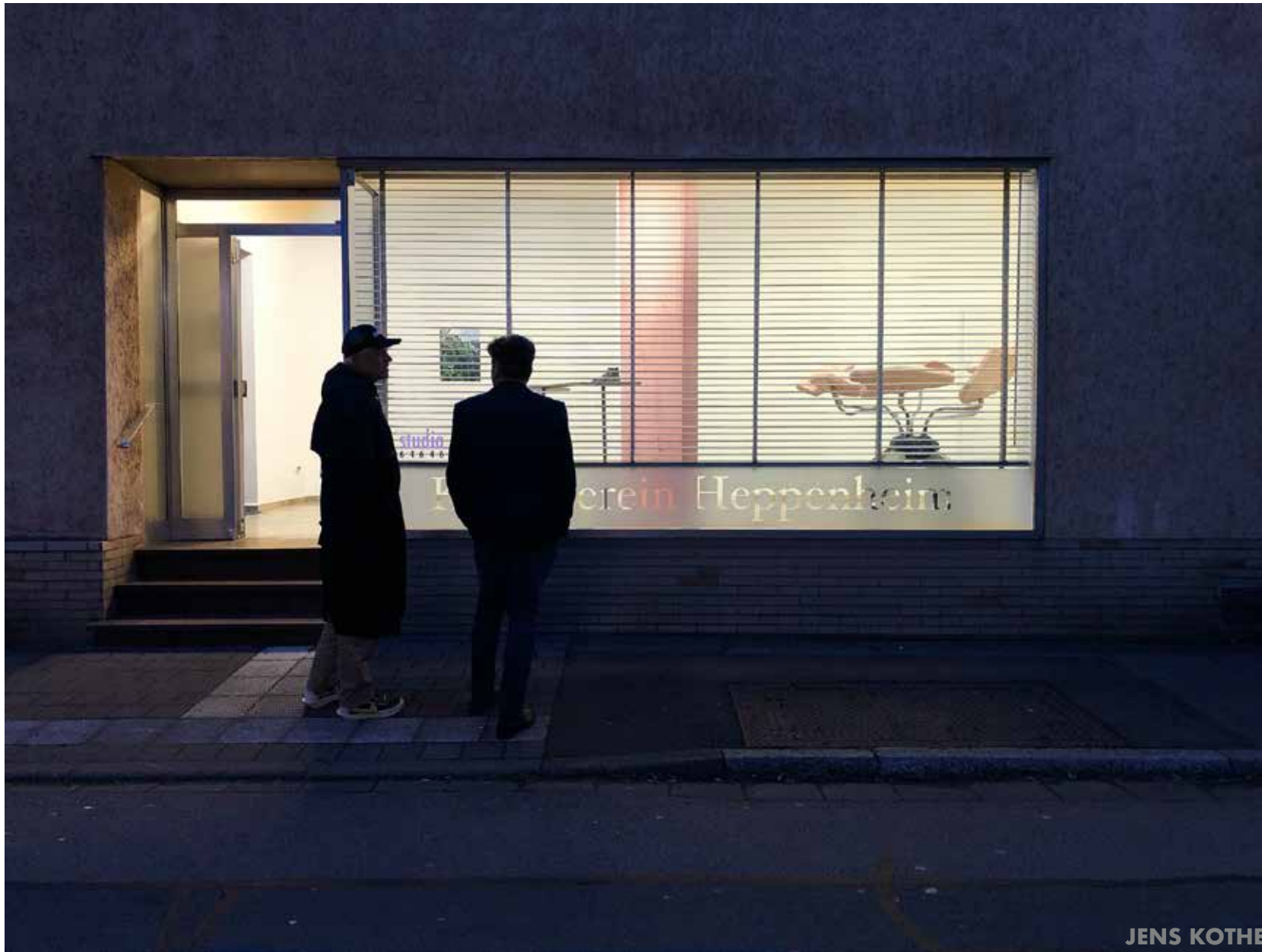
studio__64646 Kunstverein Heppenheim e.V. solo exhibition