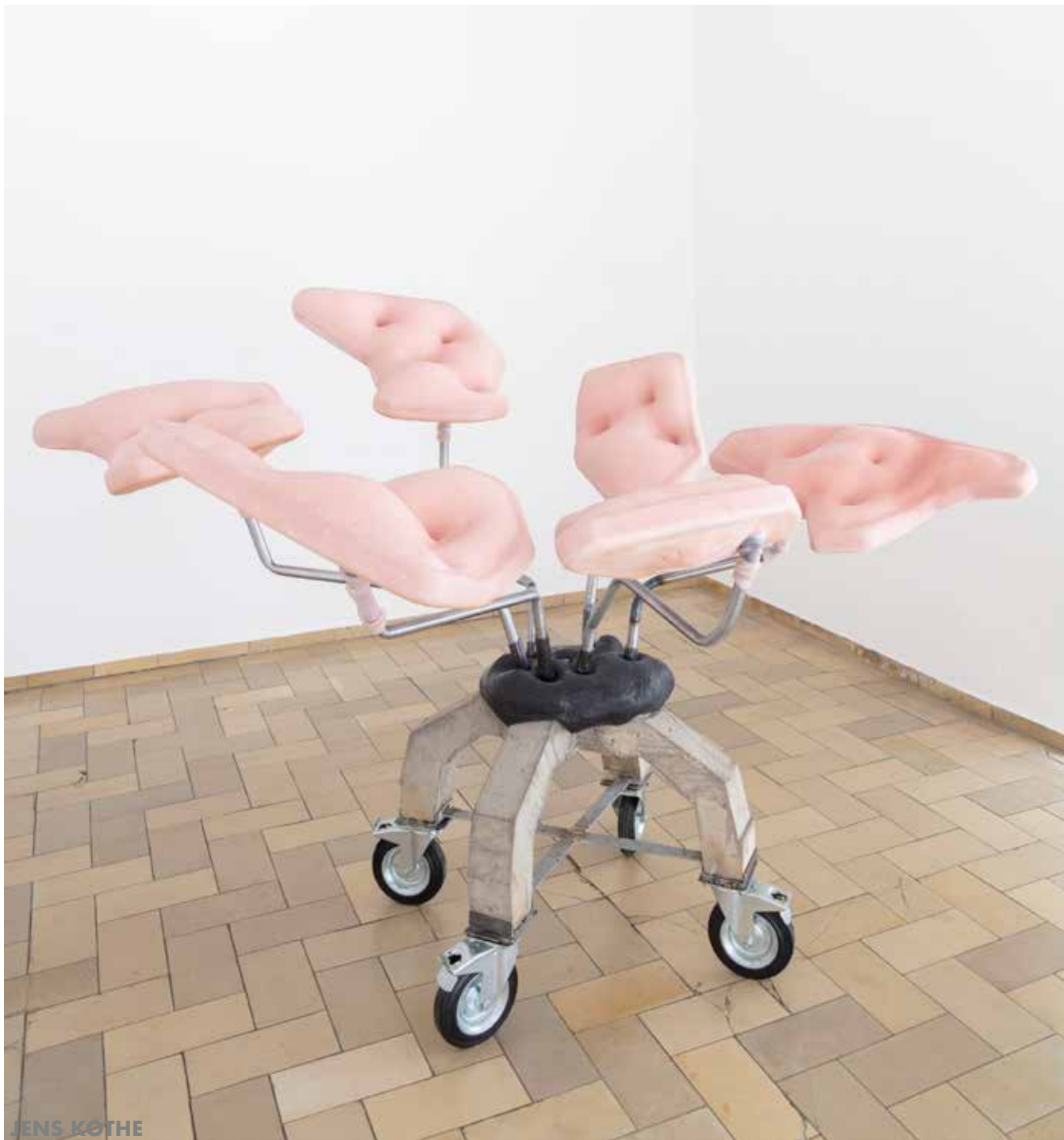
studio__64646 „Fleischkarussell“ 2022 210/ 165/ 180 cm Zementmörtel, Stahl, Silikon, Industrierollen, Bienenwachs, Pigmente, Textil, Polyurethan, Holz, Acrylspachtel, Acryl UV Schutzlack