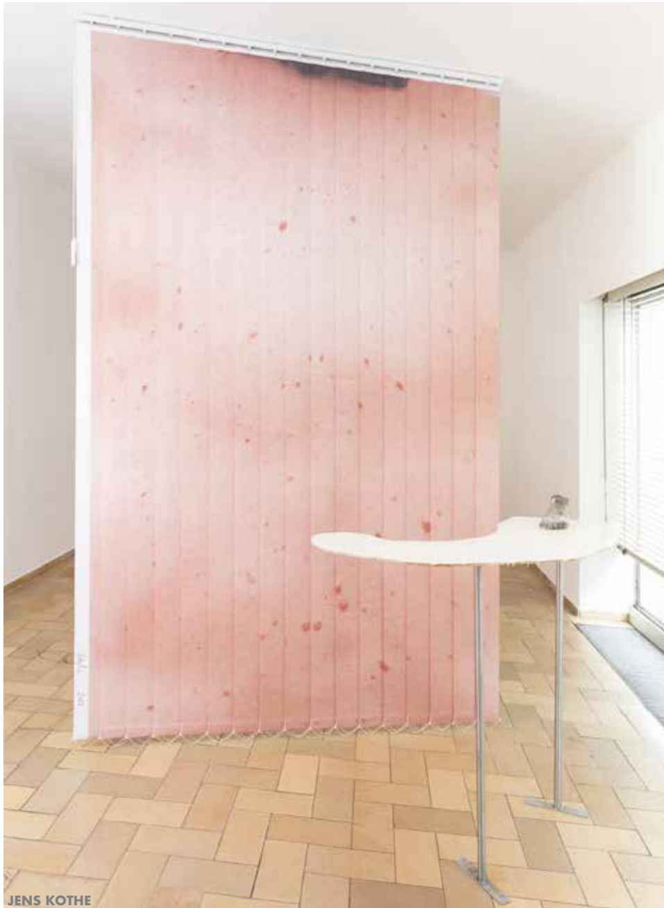
studio__64646 „Rückenstück“ 2022 Latexprint auf Lamellenvorhang 310/ 200/ 5 cm